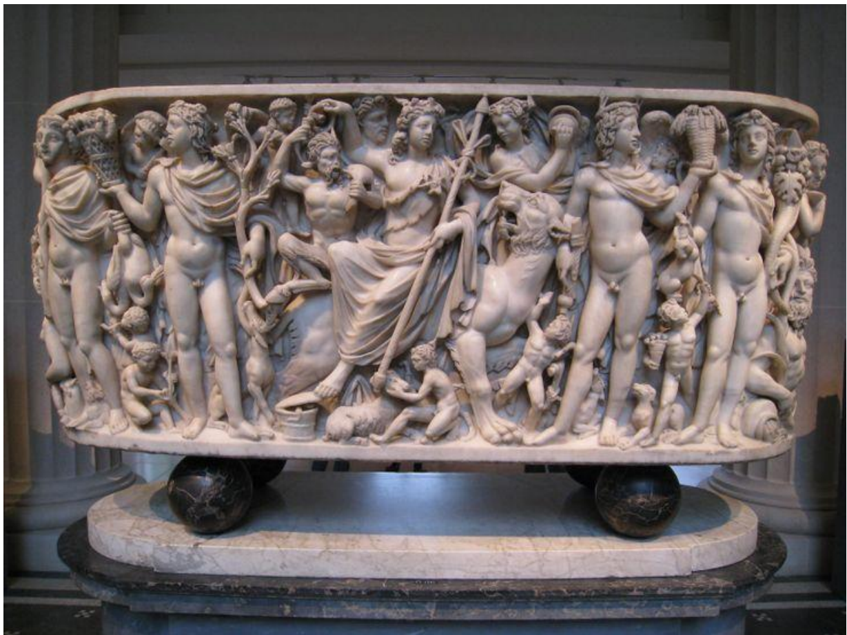
La processione di Dioniso. Dioniso che fu sempre descritto come bi-sessuale. Preferisci essere parte di questa sacra tradizione o della degenerata cultura Marxista di cristianità

Molto di questo comportamento è basato su una espressione esternalizzata di profonda condizione di odio verso se stessi da parte del nemico. Che ci detta norme così che noi non possiamo esistere in alcuna società se non come froci, mostri da baraccone. Nel mondo primordiale noi eravamo l'élite dell'aristocrazia e le classi di Sacerdoti/filosofi. Marciavamo con Alessandro dalla Grecia all'India e difendevamo l'occidente nella battaglia delle Termopili. Noi abbiamo sostenuto la cultura Ariana e siamo stati i suoi guardiani per millenni. Abbiamo un'anima unica e il nostro posto di diritto è dentro quello che oggi si chiama Satanismo Spirituale.